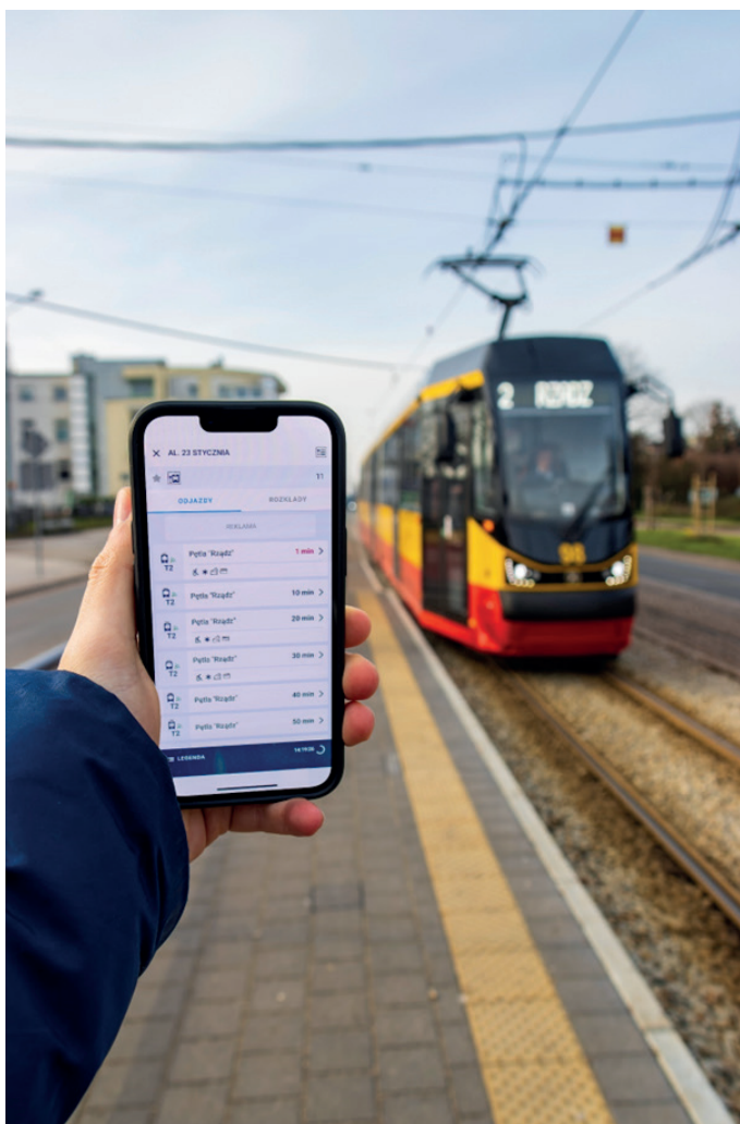
fot. Fabian Górecki

– 17 elektrycznych autobusów zakupionych z udziałem pozyskanych środków z programu Zielony Transport Publiczny, pozwoli miastu przystąpić do grona miast wykorzystujących w komunikacji miejskiej pojazdy zeroemisyjne. W trakcie procedur zakupowych są także nowe pojazdy hybrydowe, które pozwolą całkowicie odmienić transport publiczny w Grudziądzu. 1.5 Zielone przystanki