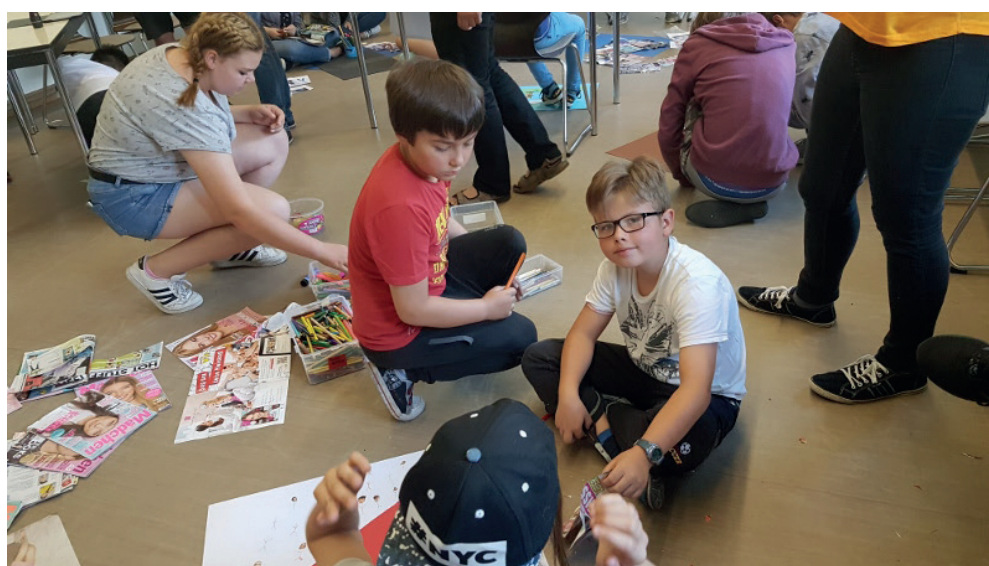
Młodzieżowy Dom Kultury