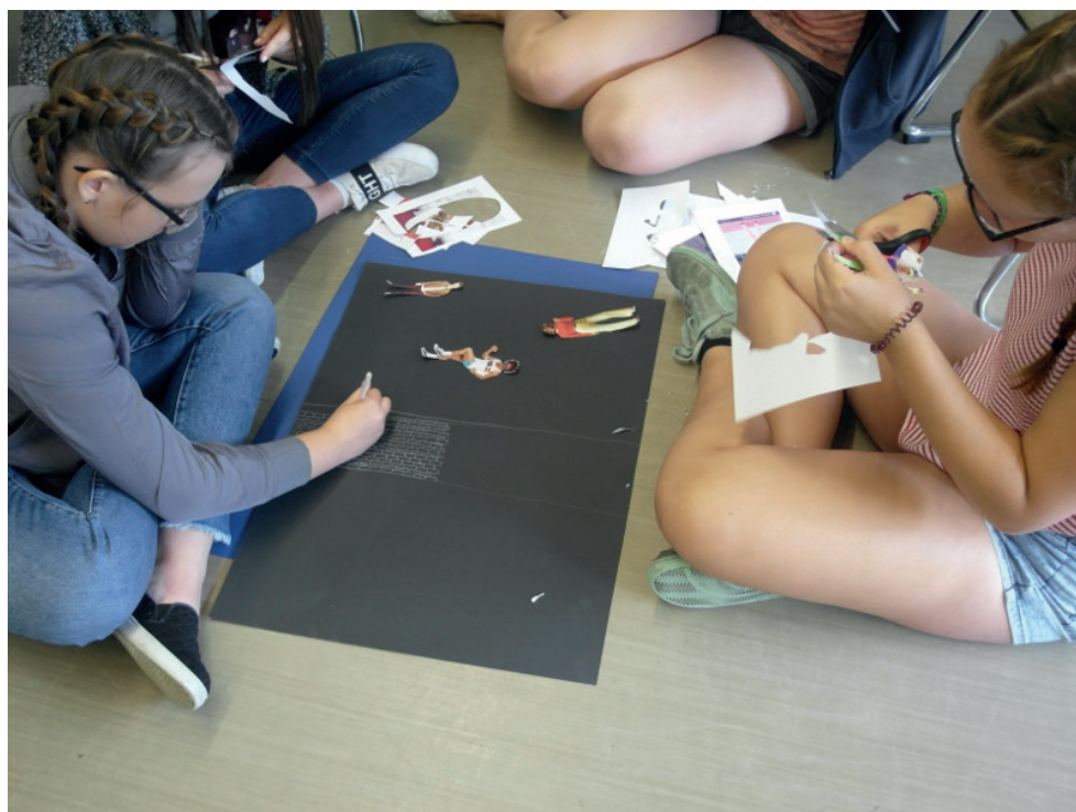
Młodzieżowy Dom Kultury