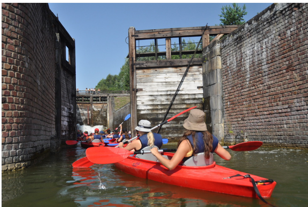
Kanał Augustowski