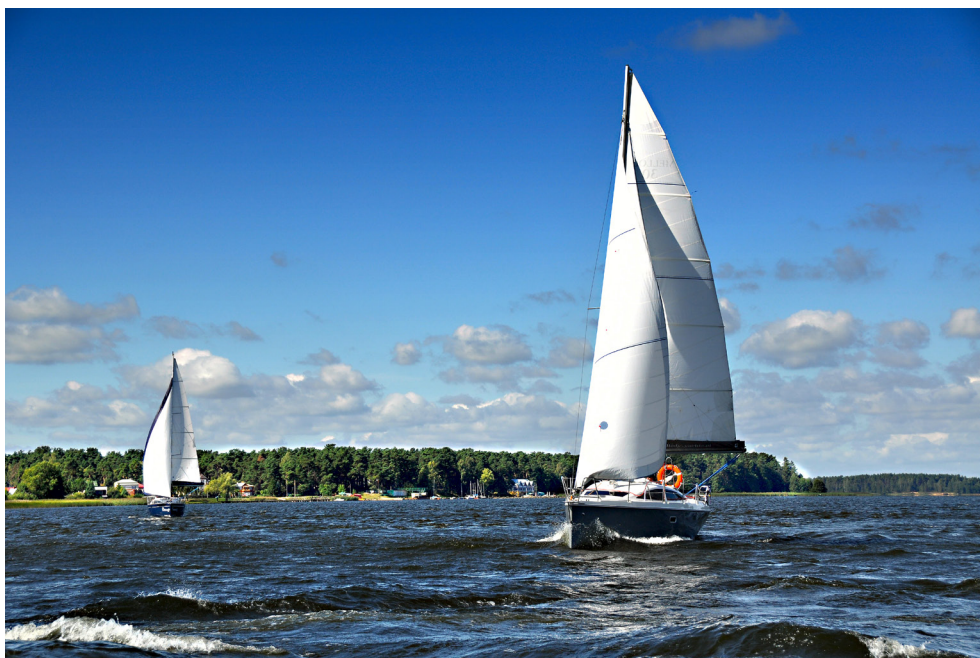
Jezioro Necko – Augustów