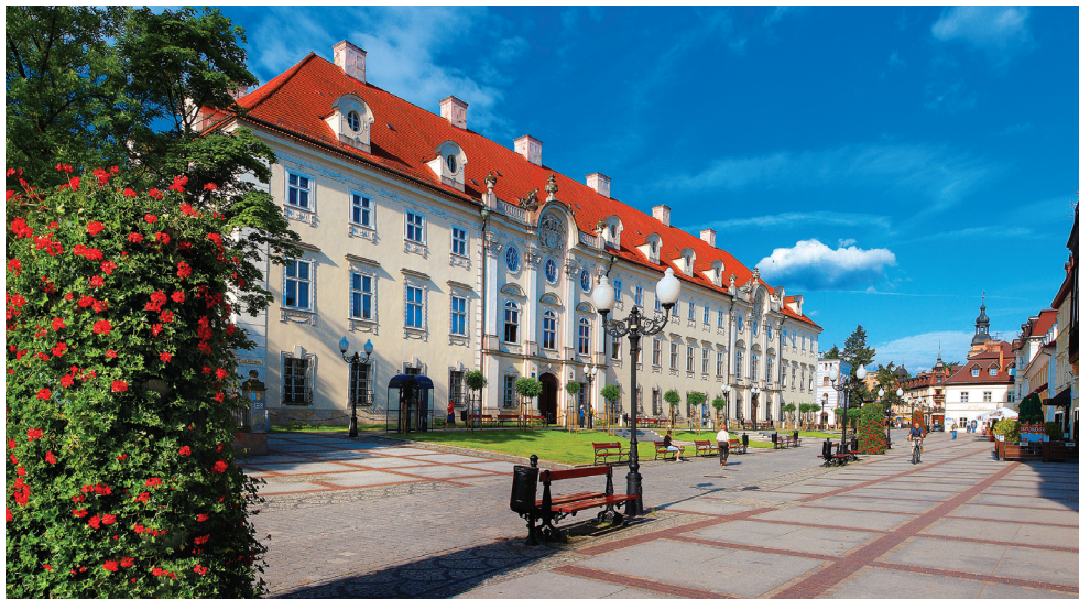
Pałac Schaffgotschów w Cieplicach-Zdroju