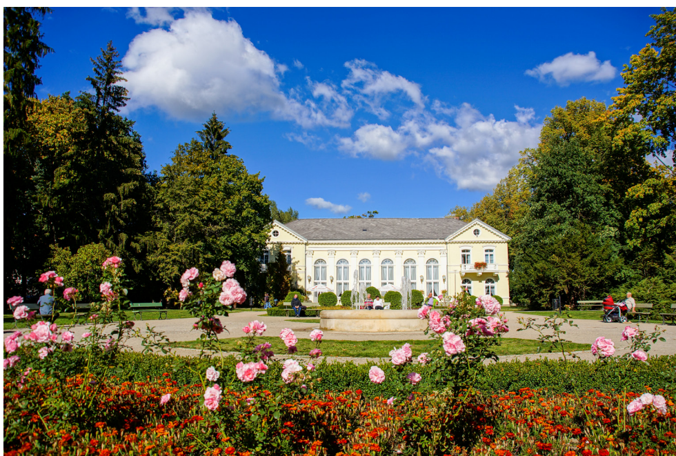
Pawilon Edward w Parku Zdrojowym w Cieplicach-Zdroju