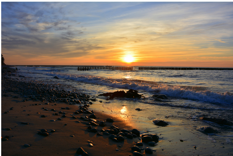
Plaża w Dąbkach