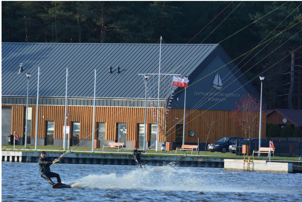
Centrum Sportów Wodnych w Dąbkach