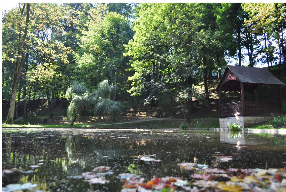
Park Zdrojowy w Długopolu-Zdroju