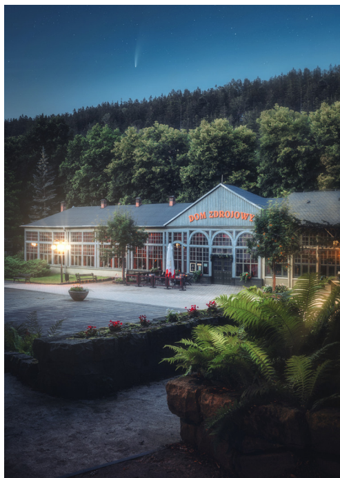
Dom Zdrojowy z pijalnią wody w Parku Zdrojowym w Długopolu-Zdroju