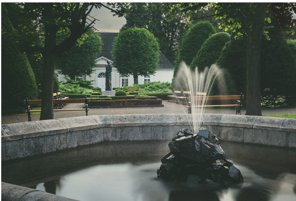
Teatr Zdrojowy im. F. Chopina oraz pomnik Fryderyka Chopina w Parku Zdrojowym – Duszniki-Zdrój