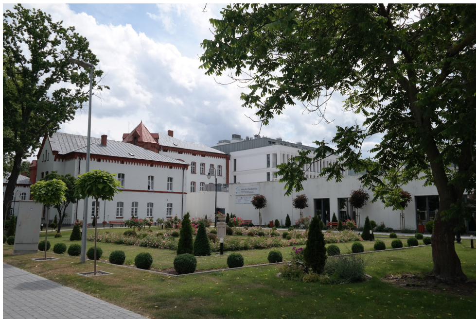
Instytut Badawczy – Uzdrowisko Kamień Pomorski