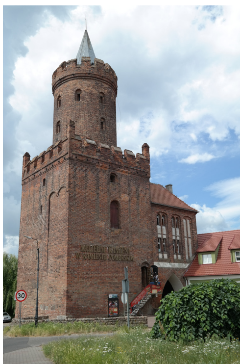
Muzeum Kamieni w Kamieniu Pomorskim