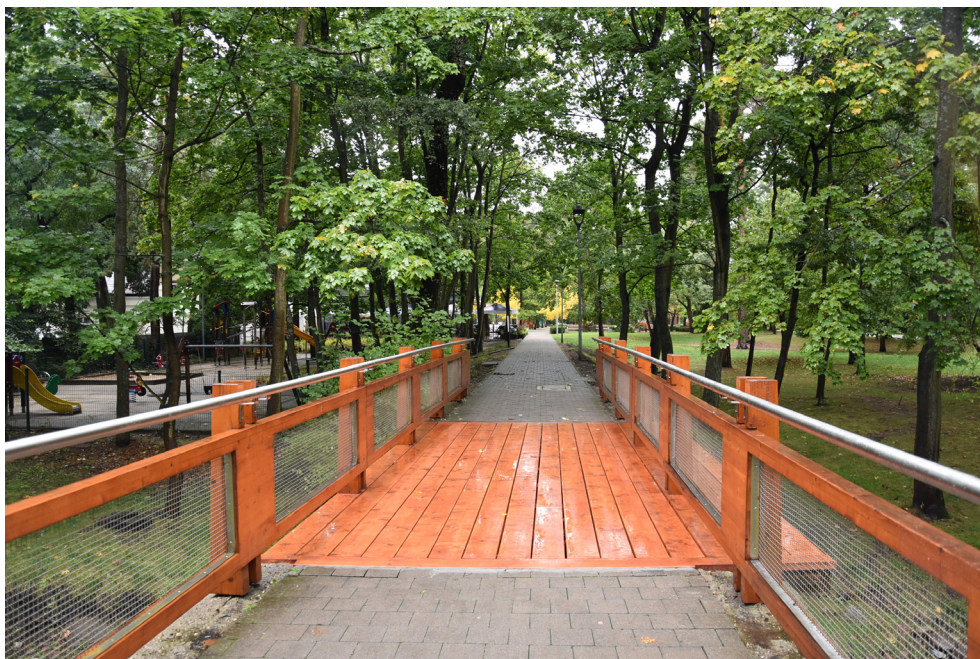
Drewniany pomost w Parku Zdrojowym – Konstancin Jeziorna