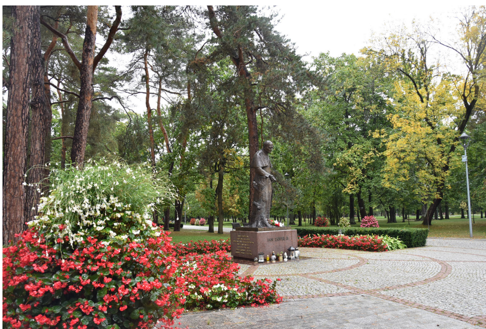
Pomnik Jana Pawła II w Parku Zdrojowym – Konstancin Jeziorna