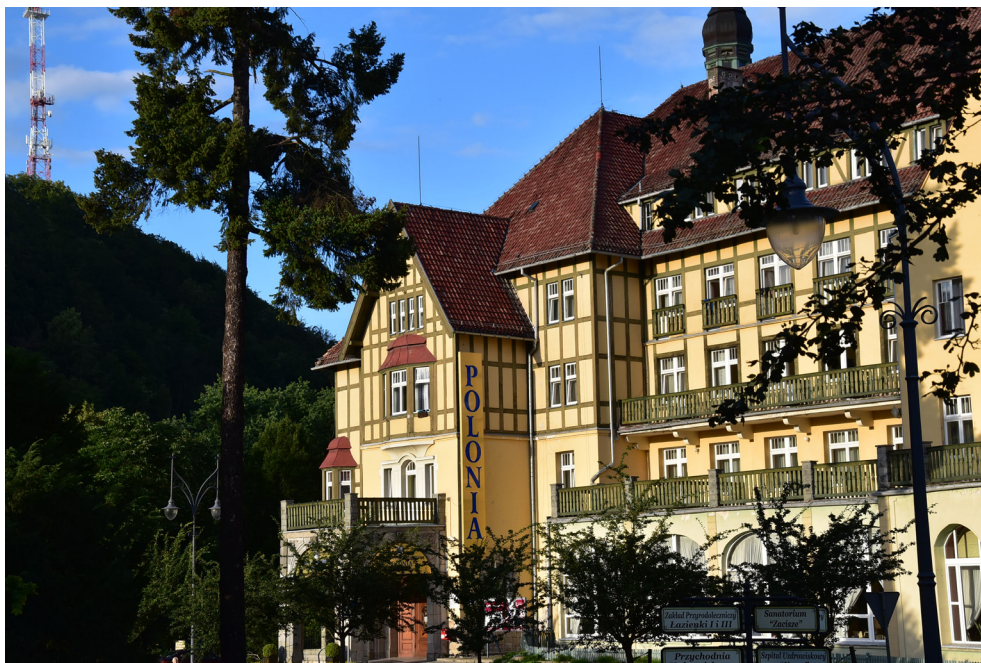
Sanatorium Polonia – Kudowa-Zdrój