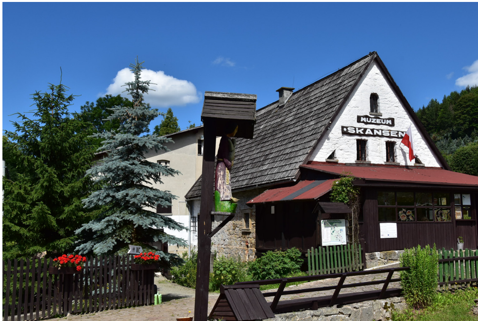
Muzeum Kultury Ludowej Pogórza Sudeckiego w Kudowie-Zdroju