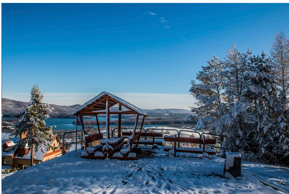
Punkt widokowy – Osiedle na górze