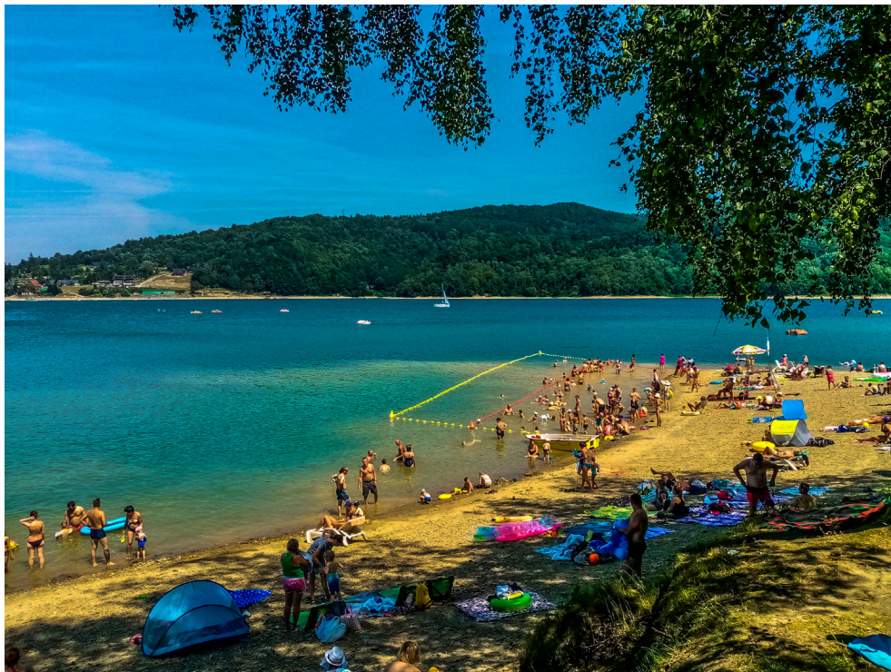
Kąpielisko Cypel w Polańczyku