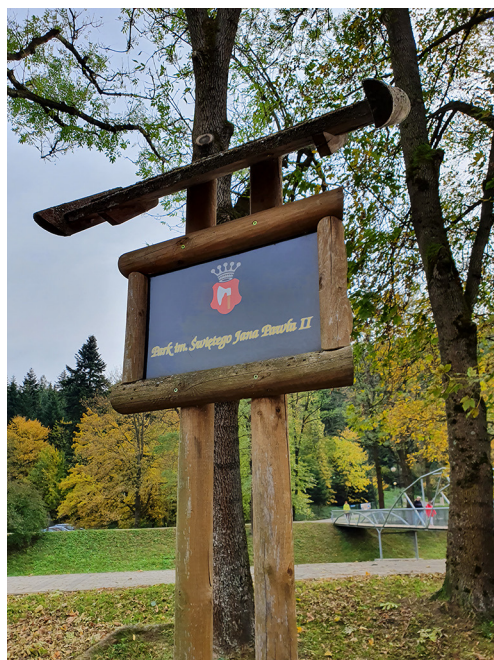
Park im. Św. Jana Pawła II w Rymanowie-Zdroju