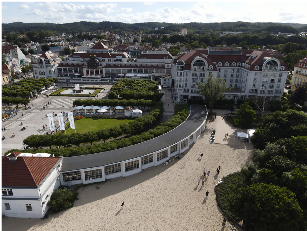
Sopot widziany z lotu ptaka