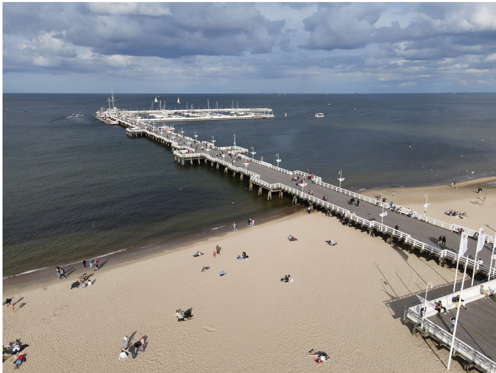
Molo w Sopocie