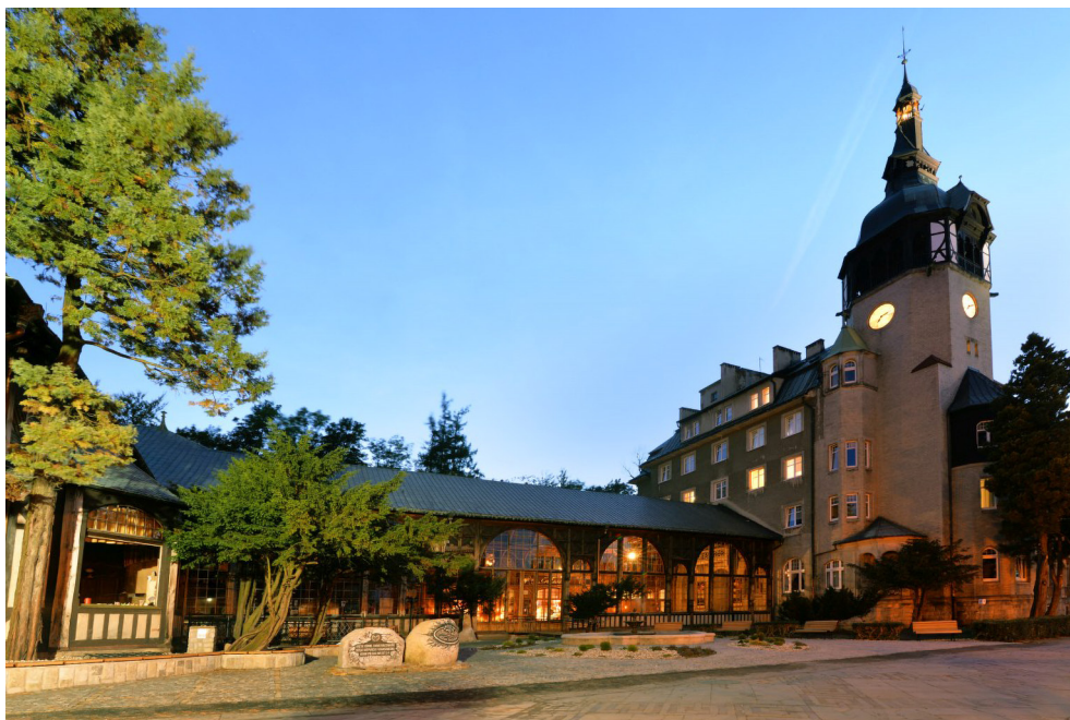
Dom Zdrojowy w Świeradowie-Zdroju