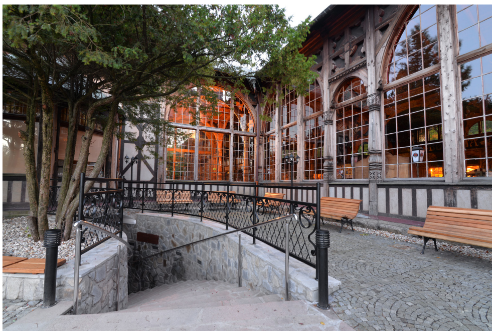
80-metrowa Hala Spacerowa w Domu Zdrojowym