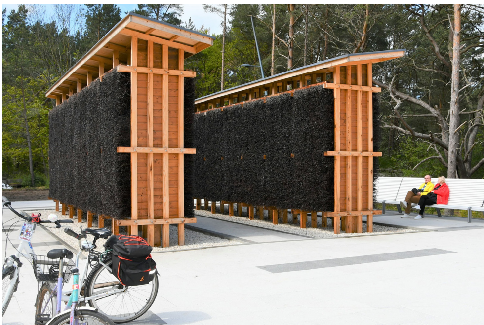
Tężnie solankowe w Świnoujściu