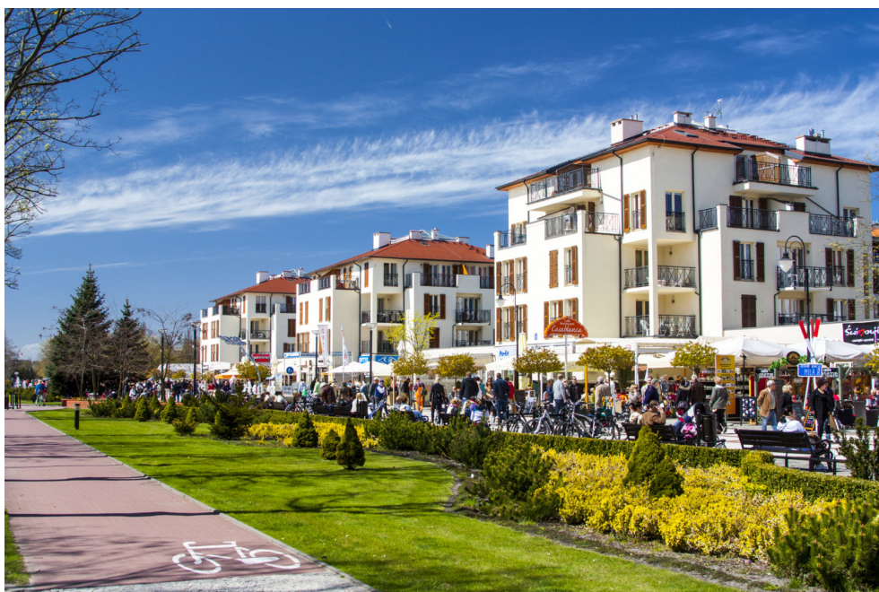
Promenada przy ul. Uzdrowskiej w Świnoujściu