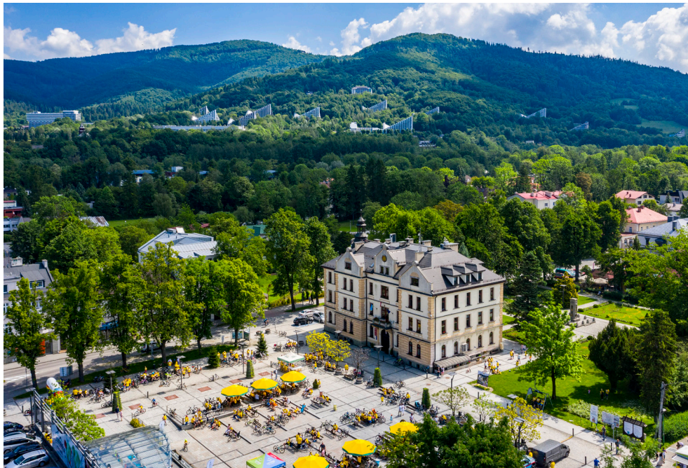
Rynek w Ustroniu i panorama pasma Równicy