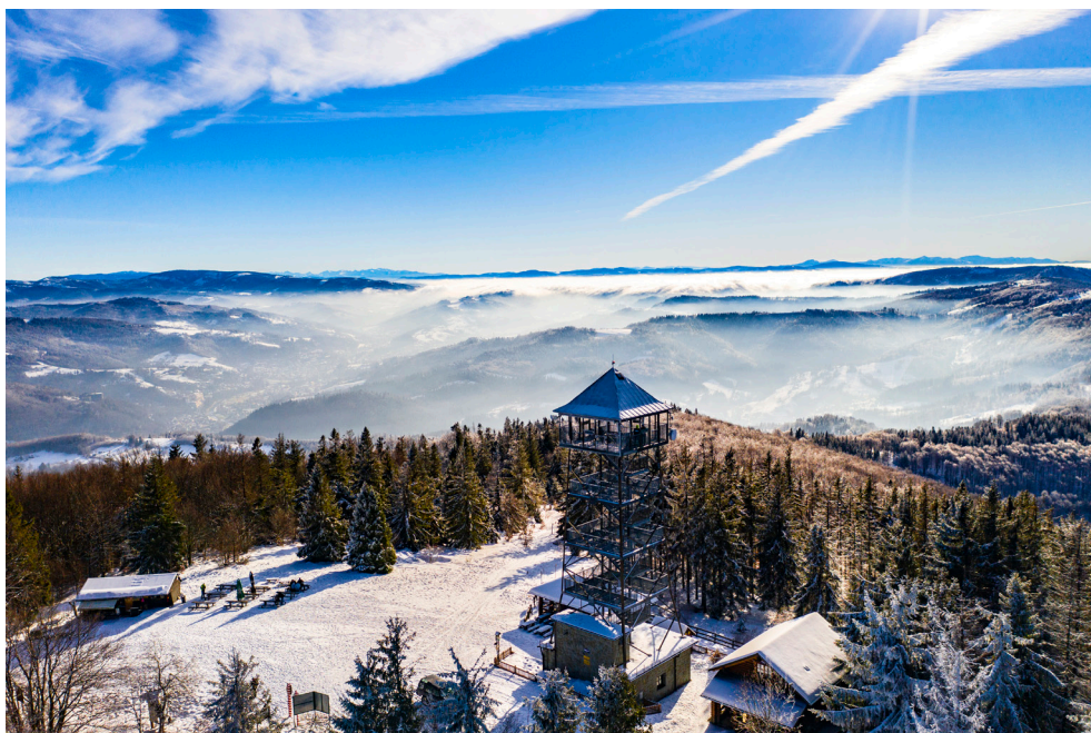
Wieża Czantoria zimą