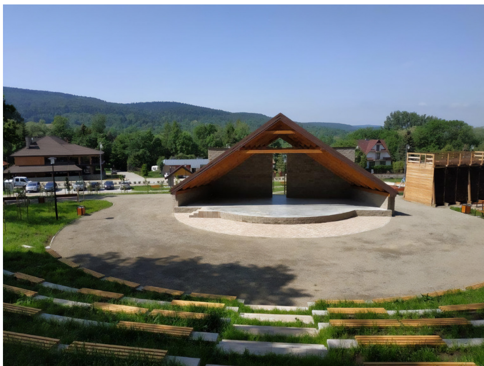
Amfiteatr – Wapienne