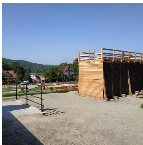
Tężnia jodowo-bromowa w Wapiennem