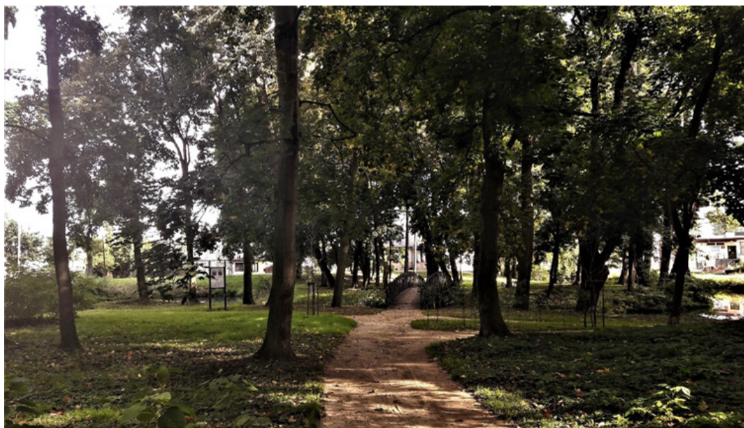
Park w Spale (miejsce do odpoczynku)