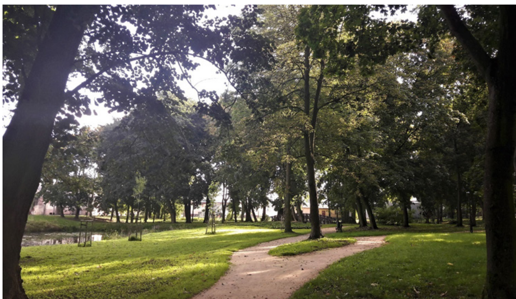
Park, autor Magdalena Adamczyk

W ramach rewitalizacji przebudowano istniejący układ komunikacyjny w celu nawiązania do historycznej kompozycji parku, wyremontowano nawierzchnię z bruku kamiennego oraz wybudowano kładkę dla pieszych. Ponadto park został wyposażony w fontannę pływającą na stawie, nowe ławki, kosze na śmieci, oświetlenie, monitoring oraz tablice informacyjne. Część trawników została poddana renowacji oraz posadzono nowe drzewa krzewy i runo parkowe.