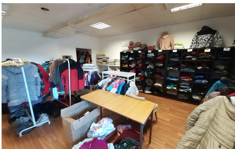
Sklepik „Pełny koszyk”