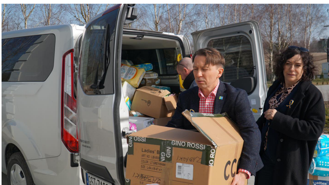
Pampersy dla ośrodków