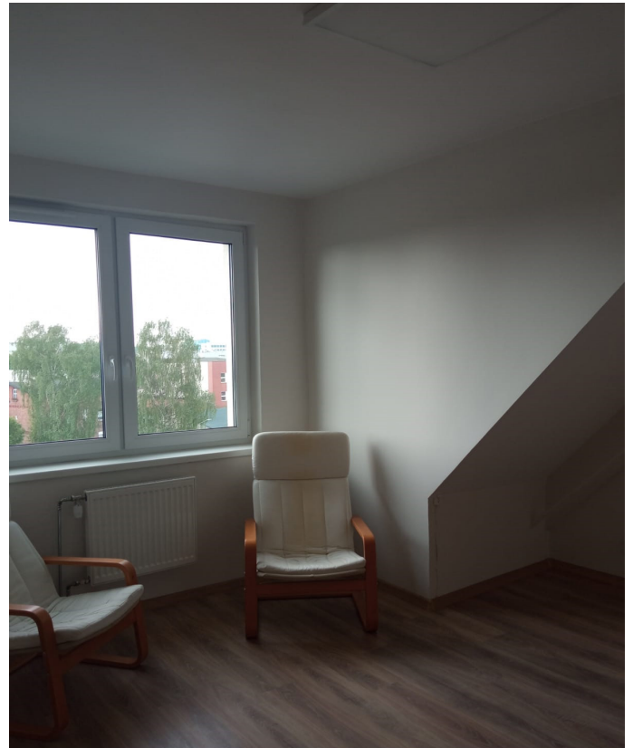
Mieszkanie II LO