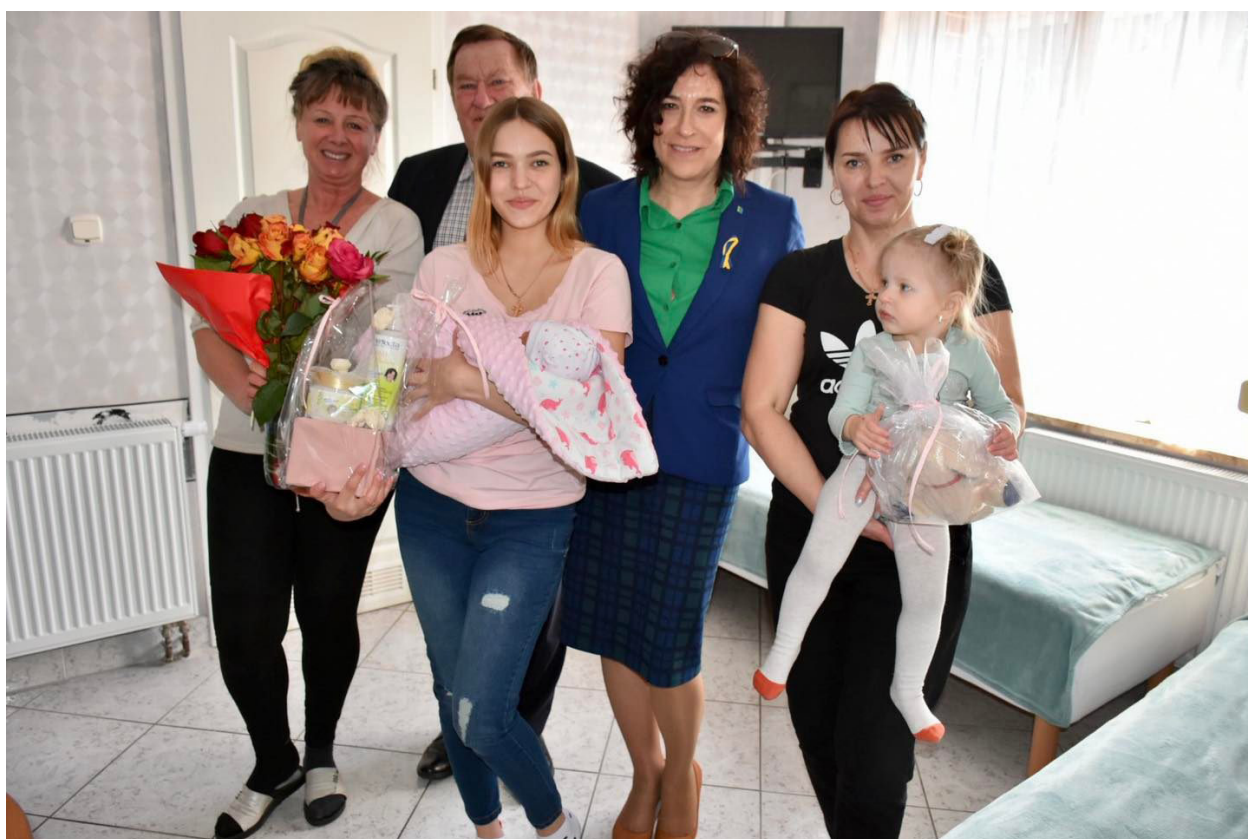
Pomoc dla pierwszego ukraińskiego dziecka