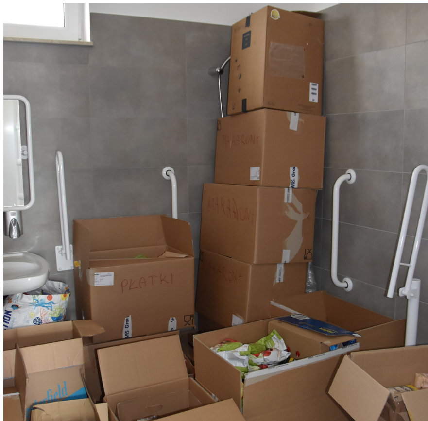
Artykuły spożywcze dla uchodźców dostępne w Punkcie Pomocy Ukrainie - K. Borowiec