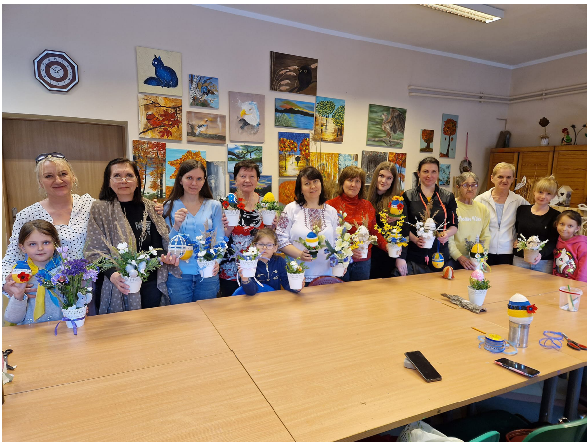
Wielkanocne warsztaty dla rodzin z Ukrainy - A. Dzida