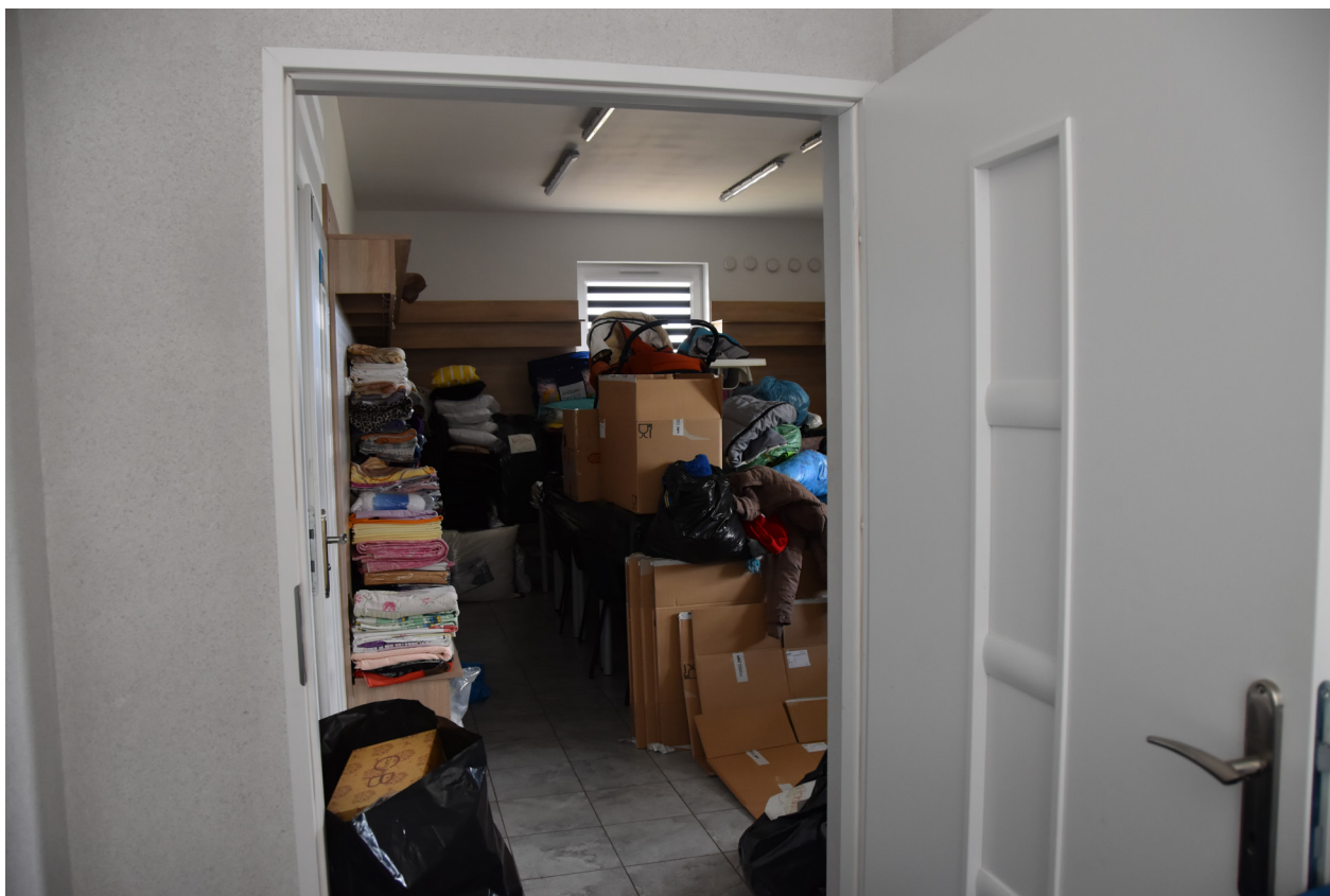
Pomieszczenie z darami w Punkcie Pomocy Ukrainie - K. Borowiec