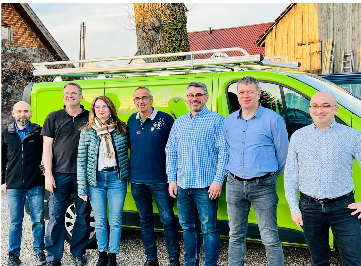
Pomoc od Friedlandów (z Niemiec)- A. Dzida