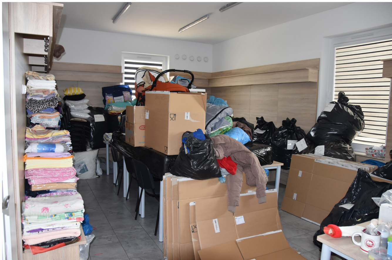
Dary w Punkcie Pomocy Ukrainie - K. Borowiec