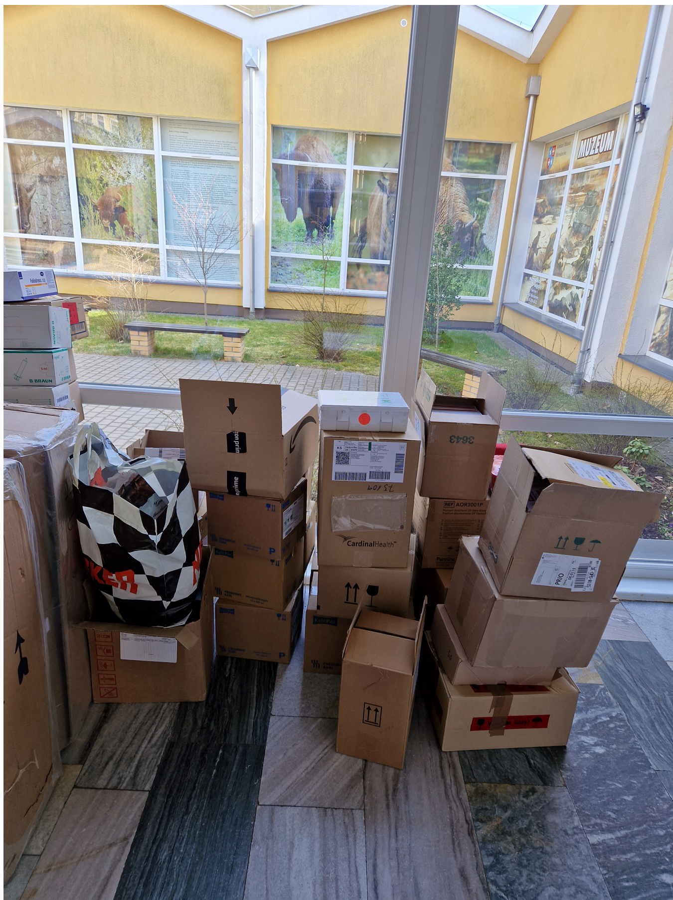
Pomoc od Friedlandów - A. Dzida