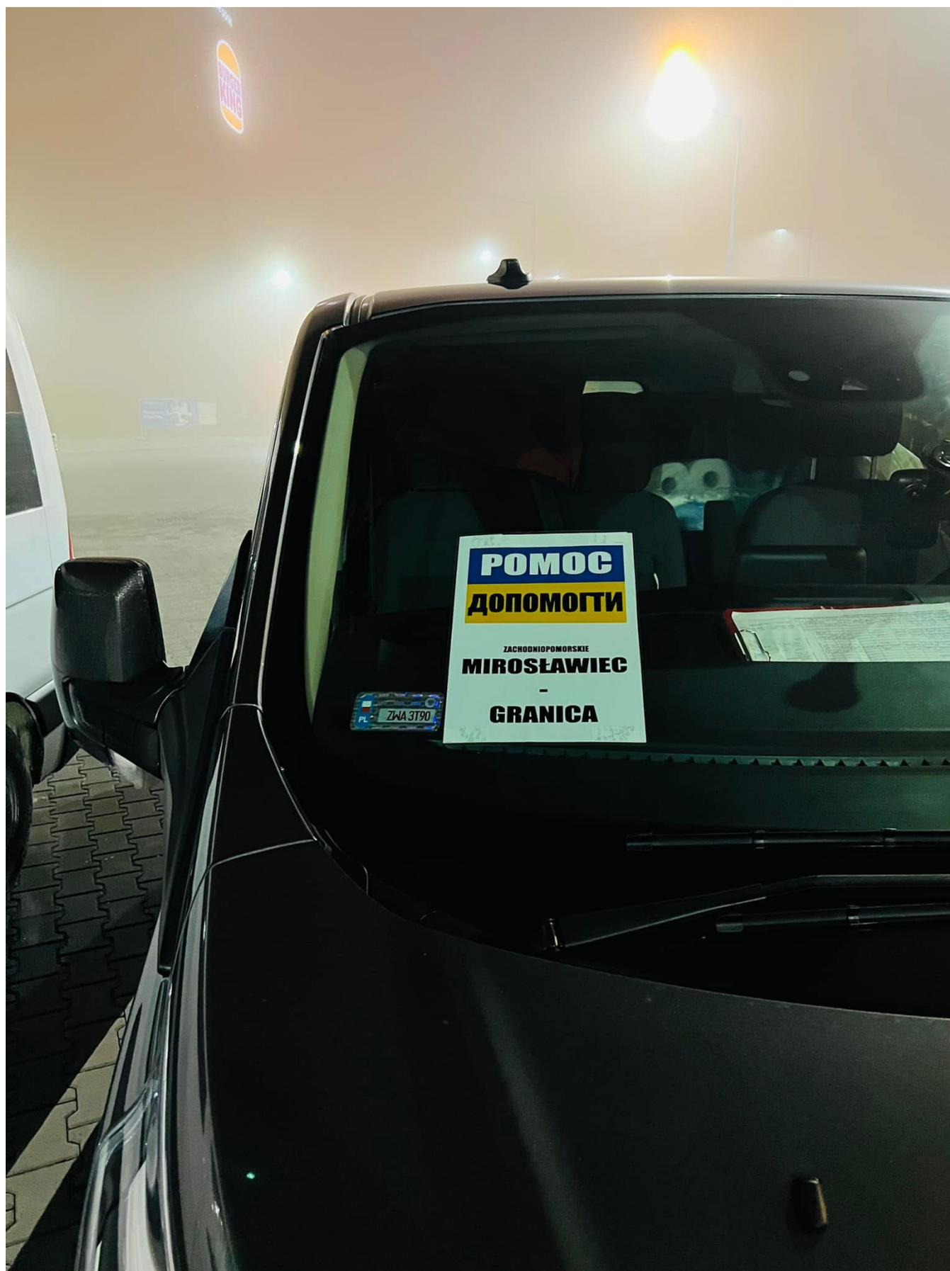
Widok auta z Mirosławca jadącego na granicę - P. Pawlik