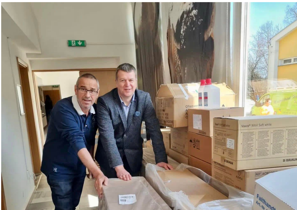
Pomoc od Friedlandów (z Niemiec)- A. Dzida