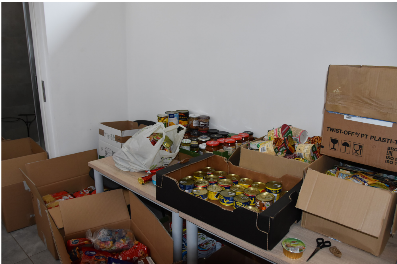
Artykuły spożywcze w Punkcie Pomocy Ukrainie - K. Borowiec