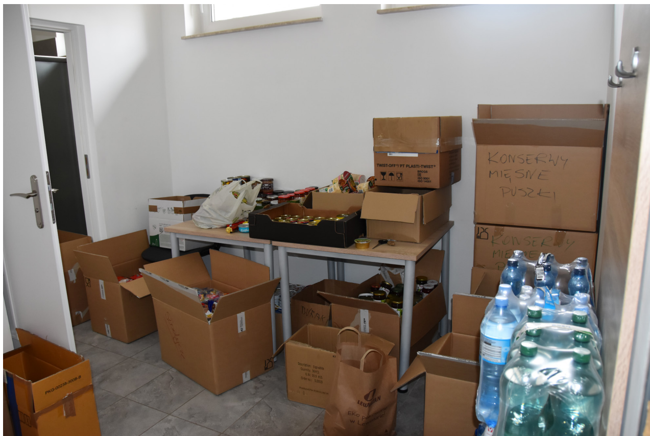
Dary w Punkcie Pomocy Ukrainie - K. Borowiec